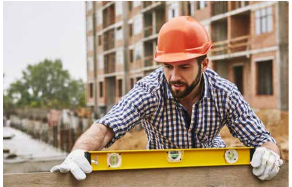
Sex av tio företag anger kompetensbrist som det största tillväxthindret.

Men det är inte bara valet av utbildning som bidrar till kompetensbrist. Över 1,3 miljoner arbetsföra människor försörjer sig inte genom arbete och är därmed beroende av bidrag för sin försörjning. Detta leder till enorma kostnader som vältras över på skattebetalarna. Enligt Adam Rydström är utanförskapet också en faktor som bidrar till kompetensbristen.