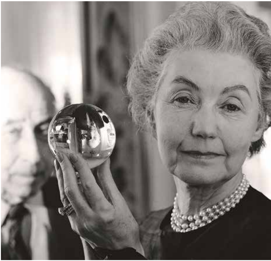
Det måste ha krävts mycket mod för att som 30-årig kvinna starta företag i 1920-talets Sverige. Estrid Ericson startade sitt företag Svenskt Tenn ur passion och höll fast vid sina ideal även när det blåste motvind. Hon höll i den dagliga driften av företaget ända fram till 1975.