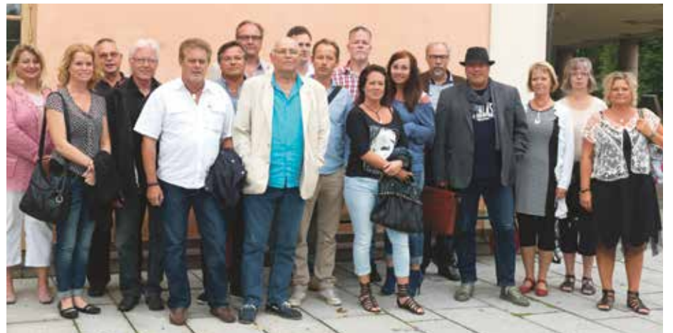
Medarbetare på Den Nya Valfärden Företagarkontakt.